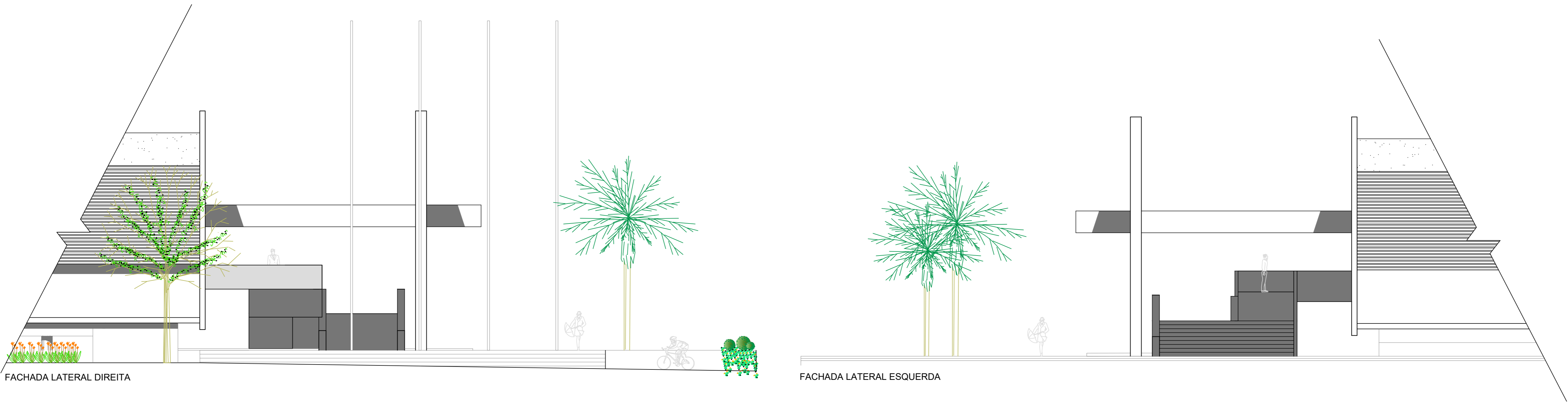
FACHADA LATERAL DIREITA